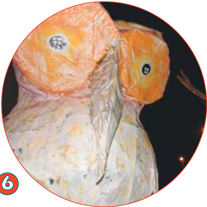
Animação de rua «Dar asas à igualdade» - Almodôvar