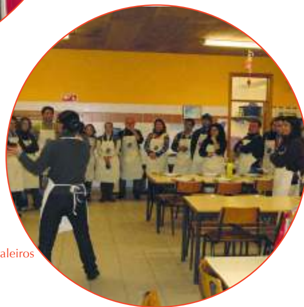
«Heroínas e heróis do lar» - Almodôvar, Castro Verde e Figueira dos Cavaleiros