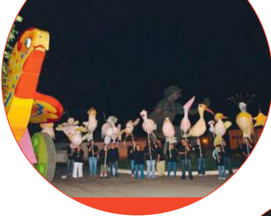
Animação de rua «Dar asas à igualdade» - Almodôvar