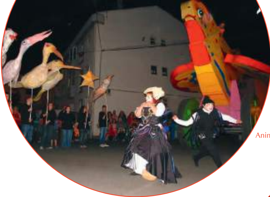
Animação de rua «Dar asas à igualdade» - Almodôvar