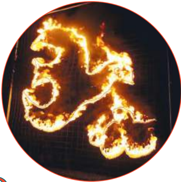
Animação de rua «Dar asas à igualdade» - Almodôvar